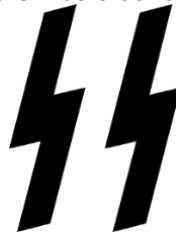
Figura 10 – O símbolo do raio ou Siegrune