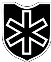
Figura 14 – Runa de Hagall