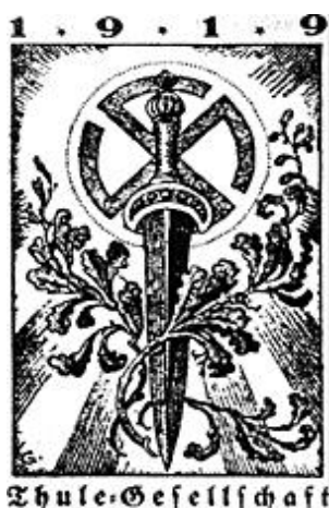
Figura 3 – Símbolo da Sociedade Thule ou Thule-Gesellschaft