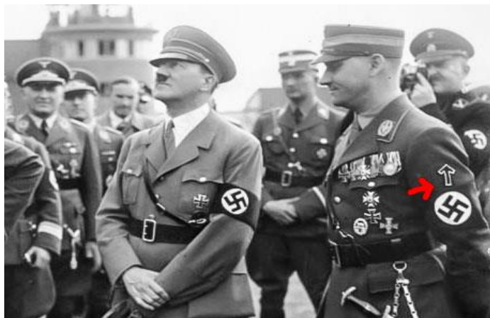
Figura 17 – Oficial da Reichsführerschule ao lado de Hitler com a runa de Tyr