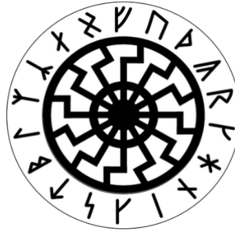
Figura 9 – O símbolo do sol negro e as runas correspondentes