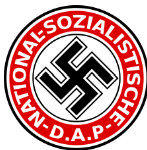
Figura 4 – Símbolo do Partido Nacional Socialista dos Trabalhadores Alemães