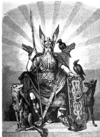
Figura 1 – Desenho de Odin ou Wotan