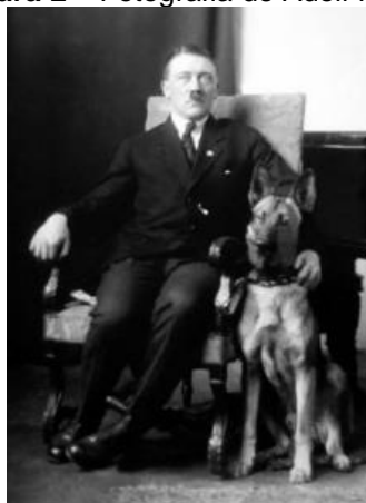
Figura 2 – Fotografia de Adolf Hitler