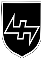
Figura 12 – Insígnia 34ª Divisão de Voluntários SS Landstorm Nederland