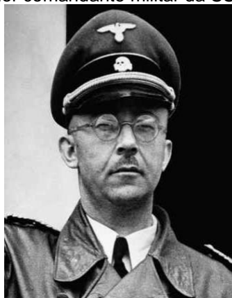
Figura 19 – Heinrich Himmler comandante militar da SS usado o símbolo da caveira