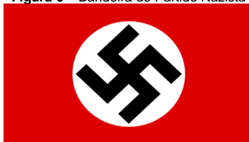
Figura 6 – Bandeira do Partido Nazista

A suástica, ou hakenkreuz , foi utilizada incessantemente como símbolo do partido, mas não como algo unicamente dos nazistas. Há um simbolismo agudamente antigo e utilizado de diferentes formas por outros povos, não sendo diferente para os nazistas; por meio de Hitler (1925), se dava como uma reprodução em torno do triunfo do povo ariano sobre os demais inferiores. A suástica na bandeira foi explicada pelos próprios nazistas. Esclarece-se que seu simbolismo se dá por meio da representação de cores em respectivas vicissitudes: sua tonalidade em vermelho é uma conotação sobre o prisma social da sociedade alemã, seguida pelo branco sobre o pensamento nacionalista do movimento nazista e, por fim, seguido pela suástica, já retratada pelo líder nazista, como o símbolo de glória da raça ariana sobre o judaísmo mundial e raças inferiores.