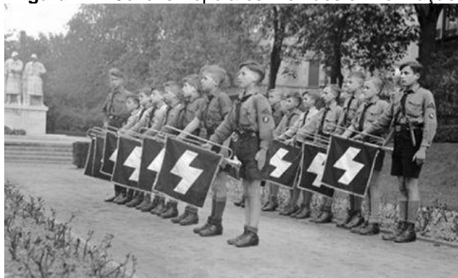
Figura 11 – Jovens Populares Alemães em formação